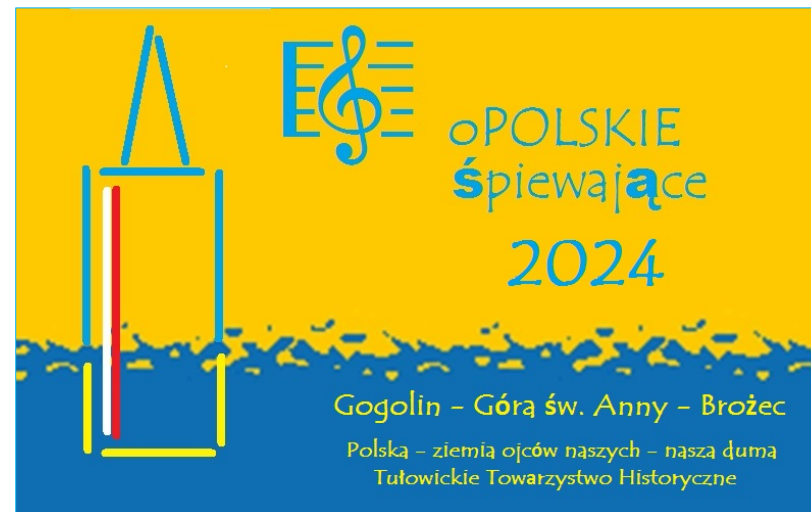
Identyfikator akcji „oPOLSKIE śpiewające – 2024”