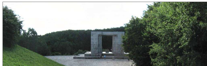
Na fotografii powyżej, Pomnik Czynu Powstańczego na Górze Świętej Anny. Fotografia z dnia 22 lipca 2007 r.