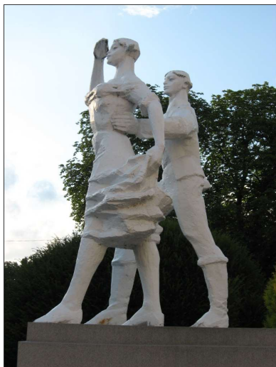
Na fotografii powyżej. Pomnik Karolinki i Karliczka w Gogolinie. Fotografia z dnia 22 lipca 2007 r.

Nie odpowiedziała, synka odbieżała, uoj, uokropno rzecz!