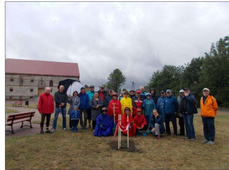
Powyżej – Gospodarze z Brożca i uczestnicy VI Rajdu Rowerowego TTH „Śladami pieśni Śląskiej” – na placu rekreacyjnym w Brożcu, przed posadzoną chwilę wcześniej „Dębem Pieśni Śląskiej”. Fotografia z dnia 24 czerwca 2018 r.

... w samym sercu opolskiej ziemi, gdzie wiatry zachodnie od wieków kołysały polskie serca i dalej kołyszą następne pokolenia. Jeszcze raz odstuchaliśmy o czym to dzisiaj szumią drzewa i srebrne fale Odry. Próbowaliśmy odnaleźć i odgadnąć klucz językowych splotów głosek i wyrazów, które wyrażały radość i smutek, pragnienia, tęsknoty i żale. Szukaliśmy splotów zdarzeń i okoliczności, skojarzeń krajobrazowych i wybrzmiały dawno melodii, które minionym pokoleniom pozwalały trwać przez mowy i wiary ojców zachowanie. 12