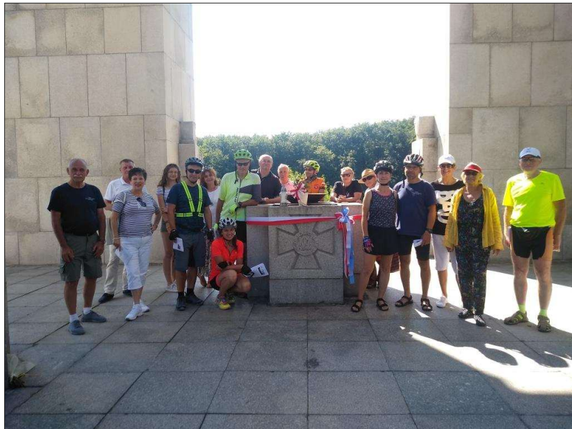
Na fotografii powyżej – Pomnik Czyny powstańczego na Górze św. Anny. W takim składzie śpiewaliśmy pieśń Już zachodzi czerwone słońce. Fotografia z dnia 25 lipca 2020 r.

Sto lat później trzecie pokolenie, Na warcie będzie stać, Gdy słońce zajdzie i rozbłyszczą gwiazdy, Wspomnimy Śląską Brać. 8