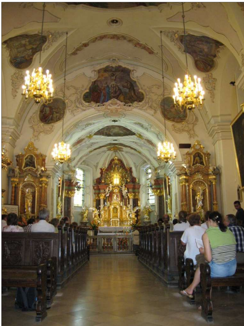
Na fotografii powyżej, wnętrze kościoła św. Anny. Fotografia z dnia 22 lipca 2007 r.